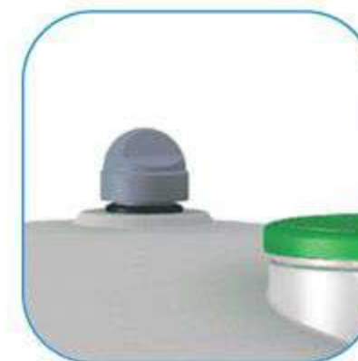
Aération en partie haute