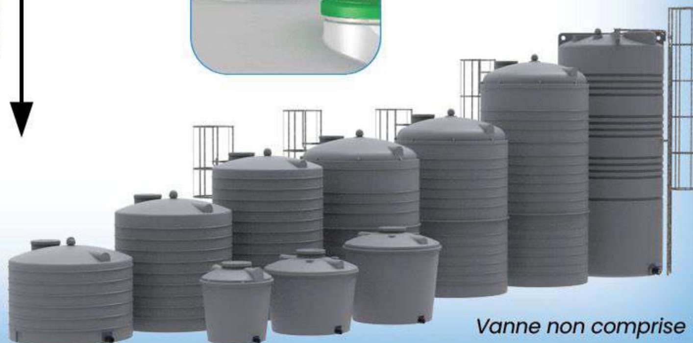
Vanne non comprise